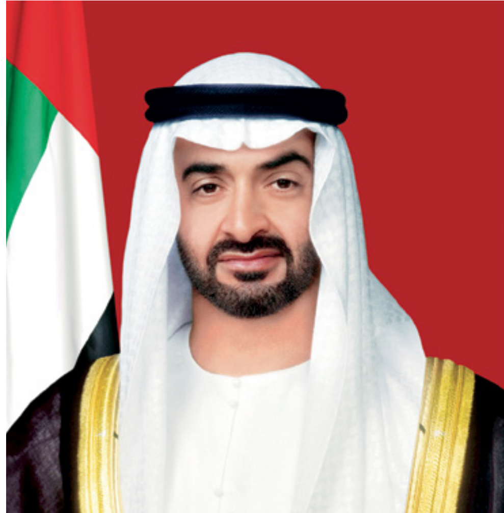
صاحب السمو الشيخ محمد بن زايد آل نهيان

ولي عهد أبوظبي، نائب القائد الأعلى للقوات المسلحة، رئيس المجلس التنفيذي لإمارة أبوظبي