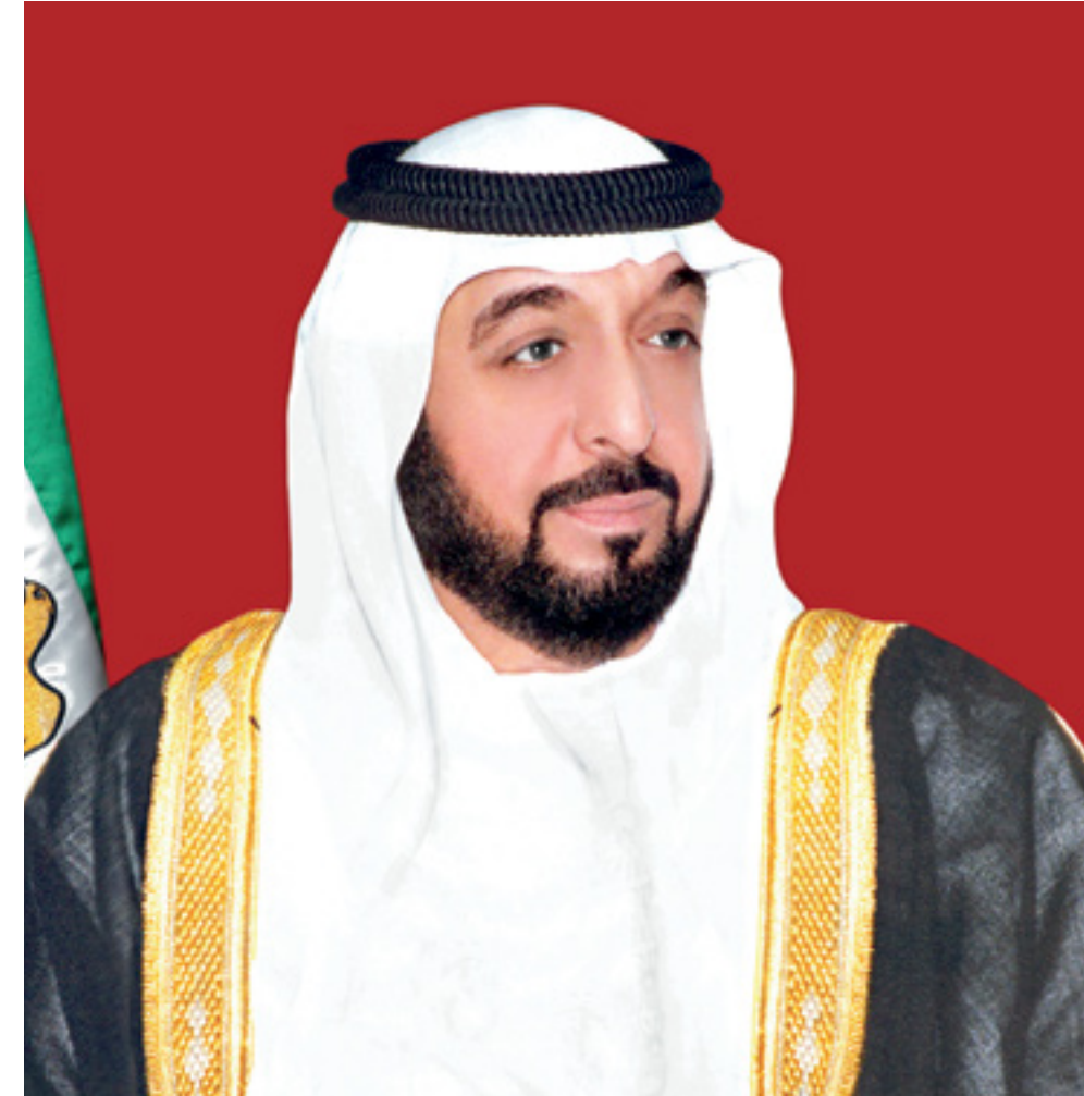
صاحب السمو الشيخ خليفة بن زايد آل نهيان

ولي عهد أبوظبي، نائب القائد الأعلى للقوات المسلحة، رئيس المجلس التنفيذي لإمارة أبوظبي